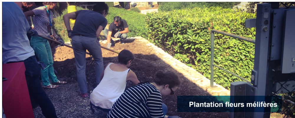
Plantation fleurs m​elif​eres