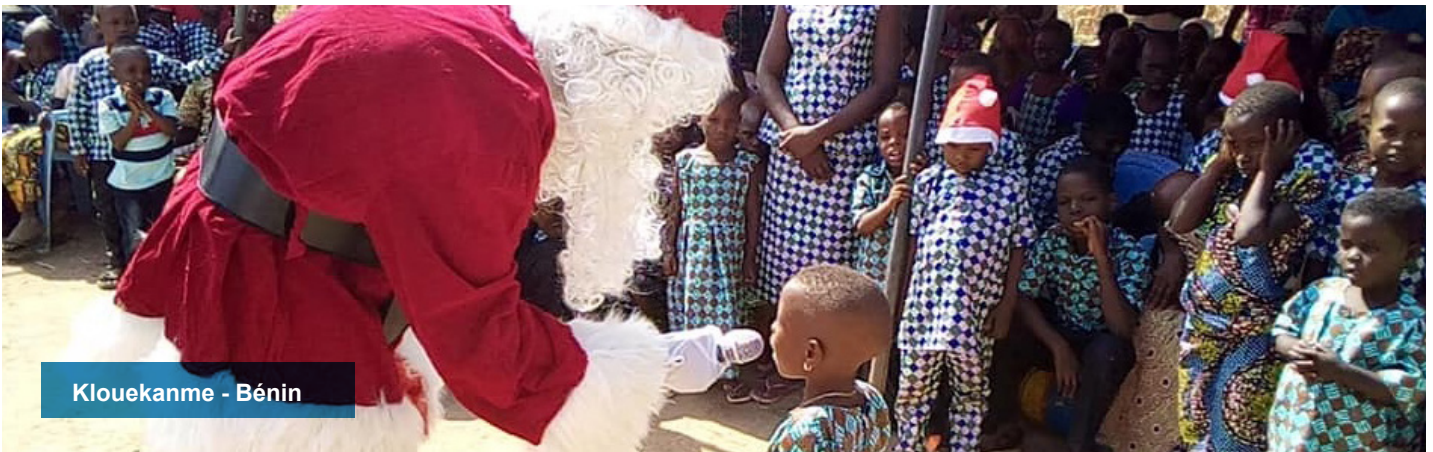
Klouekanme - Bénin