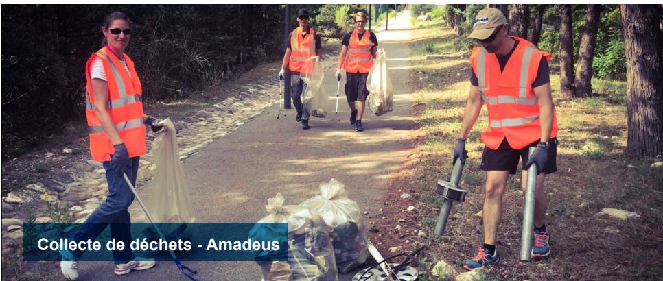
Collecte de déchets - Amadeus