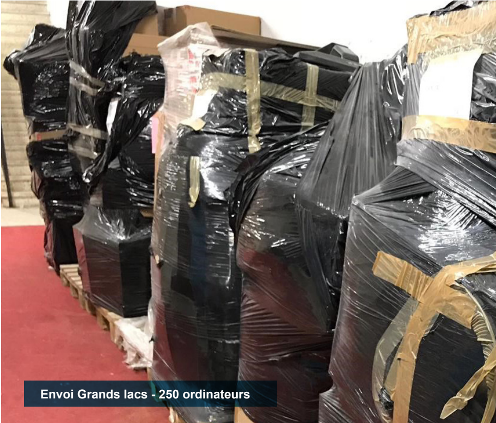
Envoi Grands lacs - 250 ordinateurs