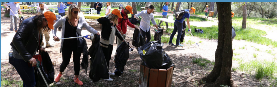
Team Building Solidaires