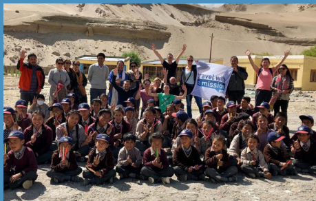
Plateforme de Twaming