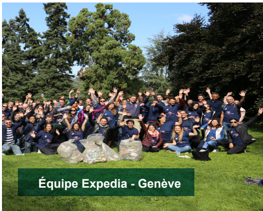
Équipe Expedia - Genève