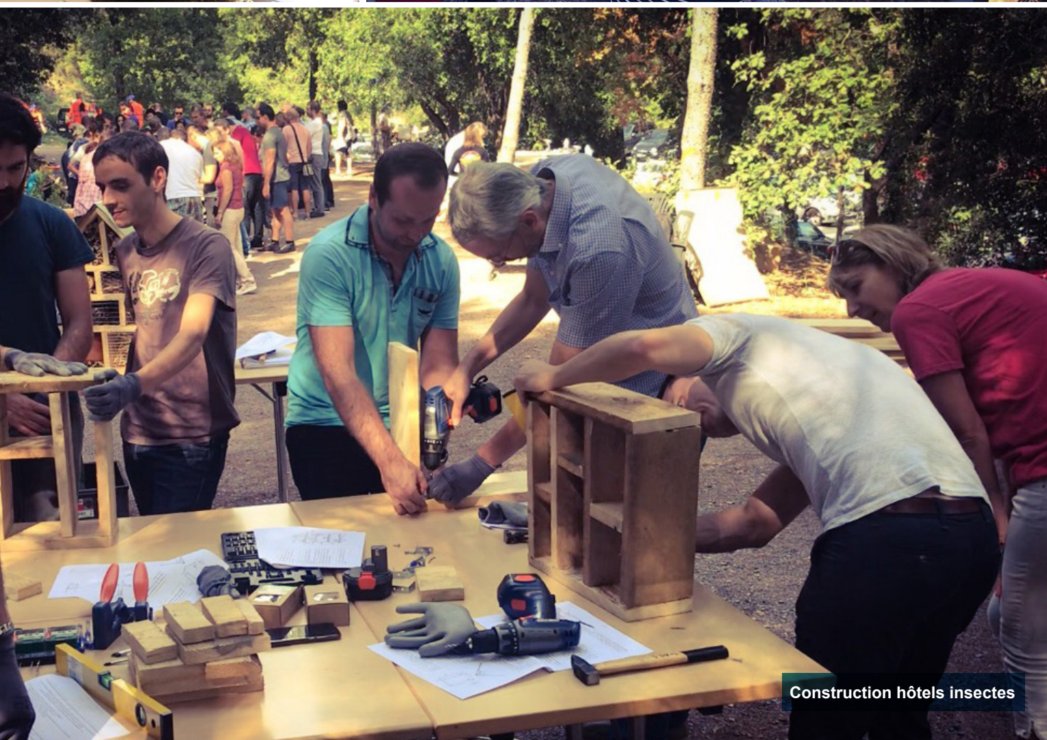
Construction h​otels insectes