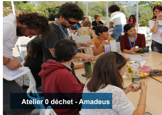
Atelier 0 déchet - Amadeus