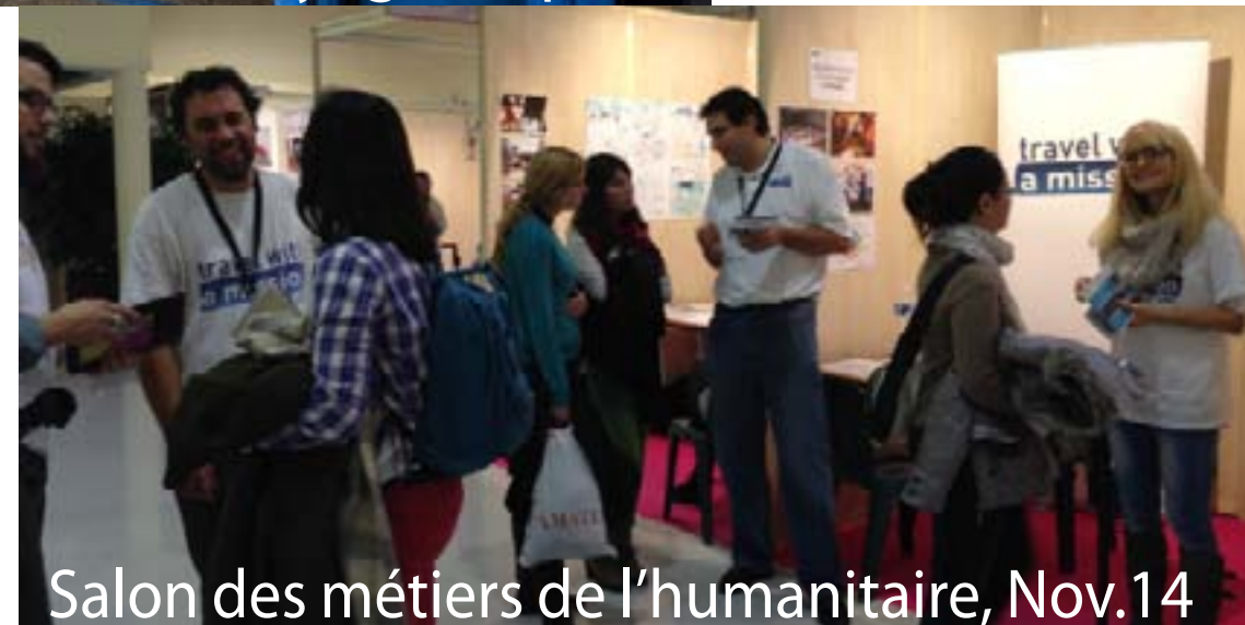
Salon des métiers de l'humanitaire, Nov.14

"Le Twaming pourrait vite s'imposer comme une tendance majeure du tourisme engagé" Grands Reportages