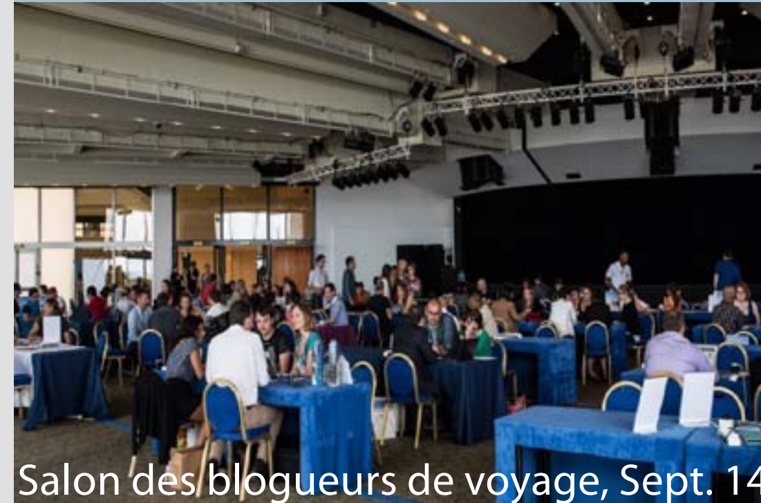
Salon des blogueurs de voyage, Sept. 14

Durant l'année 2014, TWAM a participé à plusieurs salons en France pour faire connaître le site, recruter des volontaires et trouver des partenaires.