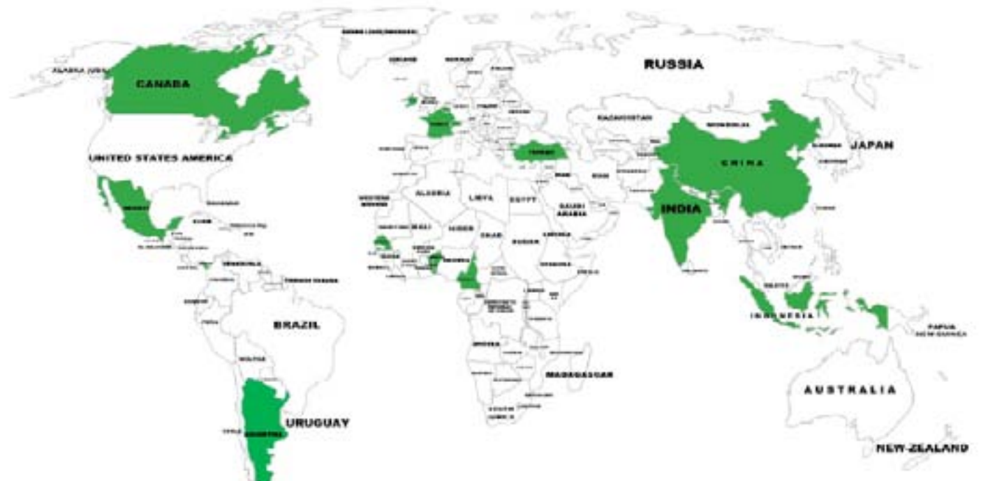
Carte des Responsables locaux à travers le monde au 31/12/14